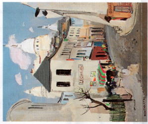
吳鐘中的《巴黎蒙馬特(五)》。

3月兩大藝術博覽會宣布取消，對本地藝術界無疑是個打擊，不過筆者對香港藝術同業的韧力有信心，而且正因為面對重大挑戰，大家更會逆境自強，迎難而上。疫情和市道低迷，並沒有影響看展覽的心情，2月中開始的精英展覽，包括一新美術館的《華人油畫與傳統》，網羅了中國畫壇二十世紀大師，以及香港老中青三代出色藝術家的作品，包括潘玉良、丁衍庸、吳冠中、朱德群、趙無極，還有沈平、吳松等多位當代香港畫家，更喜見兩位老朋友——廖井梅和胡凌謔。