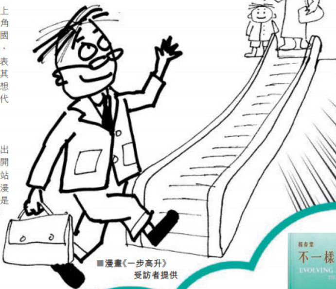
■漫畫《一步高升》

他認為，真正的針對青少年的藝術教育，應當聯合多方力量，而不是僅憑美術館單方有限的資源，甚至去依賴於特意建立一個進行此類教育的場館。惟有通過政府、教育局、美術館等多方配合，實現資源互補，藝術教育才能融入學校課程「潤物細無聲」般進行。儘管不專為青少年開設展覽，一新美術館還是盡全力為青少年提供觀展機會，通過提供免費導賞和旅巴接送服務等，吸引更多學校團體觀展。