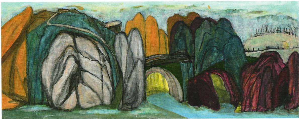
鄧凝姿《那地方（二）》布本混合媒介 48x120 厘米 2020