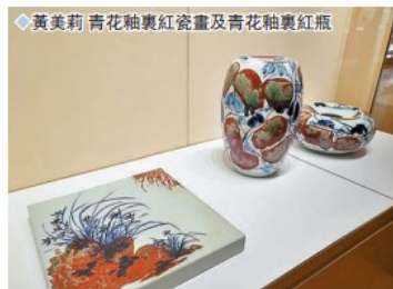
◆ 黃美莉 青花釉裏紅瓷畫及青花釉裏紅瓶