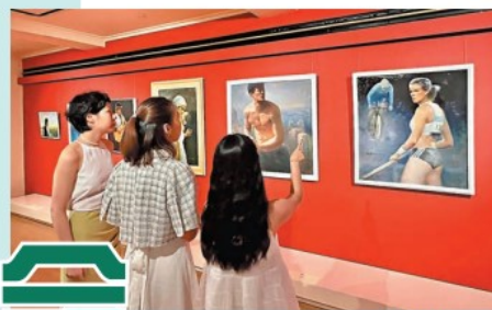
◆ 觀眾正在欣賞林伊琦的畫作。

「志於道，據於德，依於仁，遊於藝」，是儒家培育「全人」的核心價值。對藝術家而言，「遊於藝」是一種怎樣的創作狀態呢？一新美術館近日起同時舉行《黃美莉喜色》及《林伊琦悅色》兩個展覽，分別展出香港女陶藝家黃美莉85件陶藝創作，和畫家林伊琦30幅油彩作品。兩位藝術家多年來「遊於藝」，一位前往不同地方名窯學習燒製技法，一位遊遍歐洲著名博物館，以大師作品為師，最終去蕪存菁，創出令人心醉的「喜色」和「悅色」。