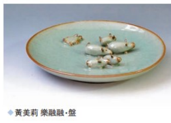
◆ 黃美莉 樂融融·盤