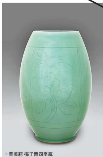
◆ 黃美莉 梅子青四季瓶