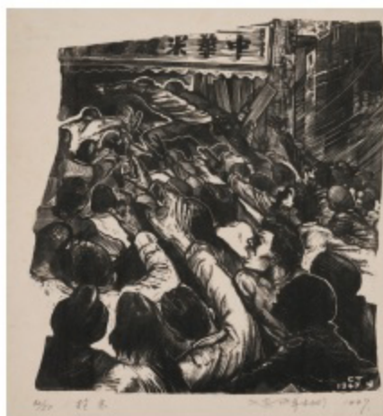
•趙延年 搶米 木刻版畫 1947 28 x 25 cm 趙延年，浙江湖州人。1938年入讀上海美術專科學校，1941年畢業於廣東省立戰時藝術館美術系，1957年起任教於中央美術學院華東分院。1991年獲「中國新興版畫60年代傑出貢獻獎」，2010年獲頒「中國美術獎·終身成就獎」。 此作初名《憤怒的人們》，後定名《搶米》。最早由李樺蘭與某刊物登載於封面，其後多次發表、展覽，影響深遠。《當代中國美術》選為40年代國統區木刻五件代表作之一。