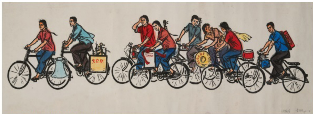
•黃錦圩 文藝輕騎 木刻版畫 1975 42 x 142.5 cm 黃錦圩為現代畫家，曾用名黃錦宇，曾在中央美術學院附中學習，擅長版畫。1957年，內蒙古自治區為了豐富農牧民的文化生活，建立一支裝備輕便、人員精簡的流動文化工作隊，在遼闊的草原上為牧區民眾演出宣傳。這個新組織名為「烏蘭牧騎」。烏蘭牧騎是蒙古語，意為「紅色的嫩芽」，後引申為「紅色文藝輕騎兵」。本幅畫面8個青年男女騎單車，載着或背負着各種樂器、擴音器等。第二輛車尾木箱有標示「文宣隊」、第四輛車頭有書型道具，書名《論無產階級專政》，第六輛車頭掛的圓草帽標有紅字「為農工服務」。