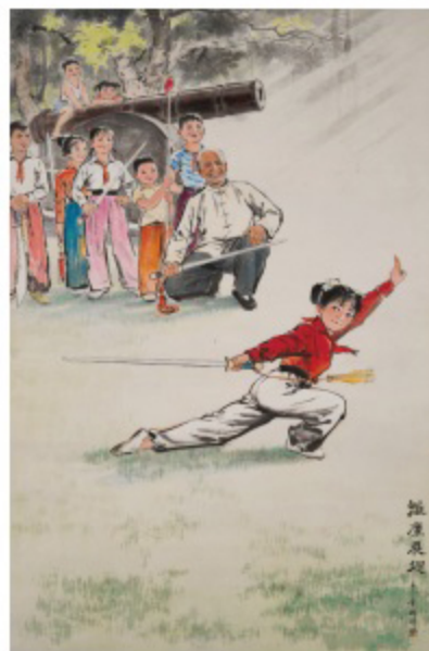
•鵬洋 雛鷹展翅 水墨設色紙本 1973 154 x 95.5 cm 鵬洋原名歐陽美麗，曾被譽為「將陽光帶進水墨畫中」，《雛鷹展翅》畫是其成名作。1973年獲選入北京全國美展。於1973、74年間大量印刷，流通全國，知名度極高。 《雛鷹展翅》的畫面有9人，白髮老師傅持劍蹲下，領着一眾手執兵器的小朋友在聚看紅衣女孩舞劍，那一招「叉步反撩」，英姿勃發，曲盡其妙。右上方幾度「耶穌光」直射，顯得整個畫面「紅、光、亮」，這很合乎當時樣板戲的要求。