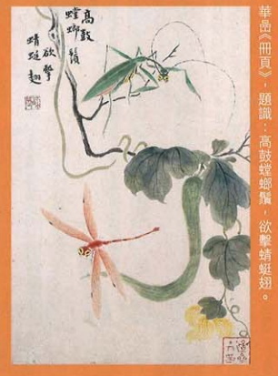
華浩《高鼓螺鐘》，題識：高鼓螺鐘，欲擊蟬蛻頰。

欣賞作品時，突然在想，眾裏尋他，一濤居得此畫，復得饒教授親鑑，今日展示人前，見得知音，何嘗不是一種緣份的延續？這樣說來，展覽也許可以名為《緣起丹青》？