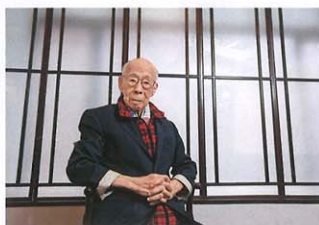
石濤巨作《蓮社圖》(下圖)得到饒宗頤教授(上圖)親自鑑賞。